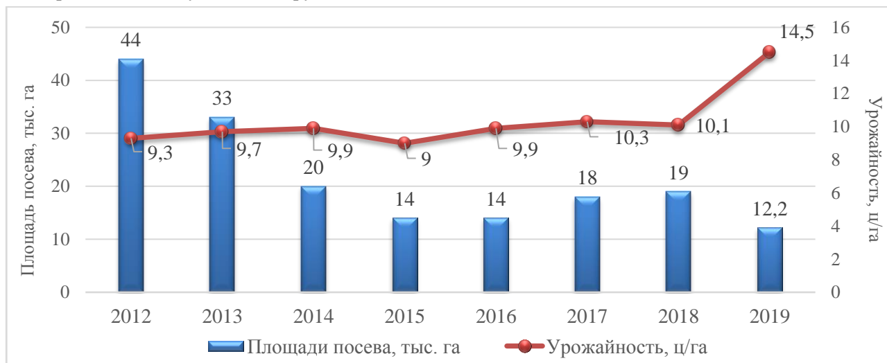
Рис 1. Динамика посевных площадей и урожайности плодов гречихи в Республике Беларусь

Объектом исследования выступал диплоидный сорт гречихи Лакнея с детерминантным морфотипом растения, внесенный в Госреестр РБ в 2012 г. Согласно данным ГСИ РБ средняя урожайность плодов за 2009–2011 гг. составила 21,0 ц/га, максимальная – 33,0 ц/га. Средняя масса 1000 семян 29,9 г. Выравненность плодов 85 %, пленчатость 22,3 %. Выход крупы 72 %, крупяного ядра 55 %, содержание белка в крупе 14,8 %. Вкус каши 5 баллов. Включен в список наиболее ценных по качеству сортов [9]. К моменту проведения исследований сорт высевался на площади 225 га. К 2019 году его посеы увеличились до 1243 га или в 5,5 раза и достигли доли 7,5 % от всех площадей, занимаемых гречихой в Республике Беларусь.