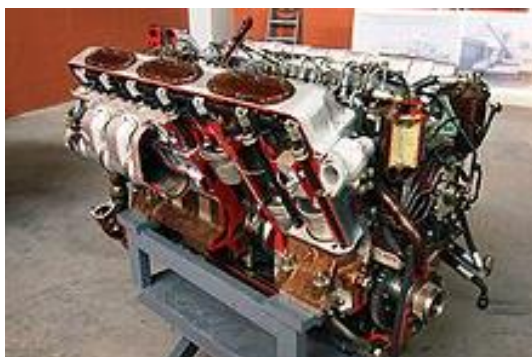
Рис. 2. Многотопливный танковый дизель В-92

Подавляющее большинство выпускаемых дизельных двигателей снабжено системой турбонаддува, а в последние годы – и промежуточными охладителями наддувочного воздуха. Дизели имеют незначительную (на 2–9 %) потерю мощности в сравнении с ГТД, экономят топлива до 40 %, а также высокие показатели многотопливности. Кроме того, дизели легко переоборудуются для использования в качестве энергетических установок транспортных средств.