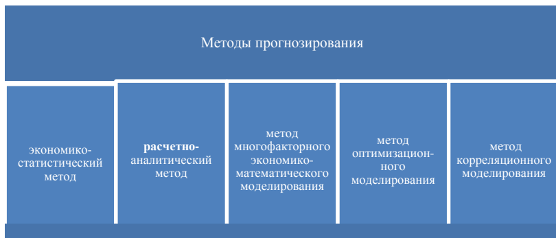
Рис. 6.1. Методы прогнозирования

При составлении финансовой стратегии на долгосрочную перспективу применяются методы прогнозирования, представленные на рис. 6.1.