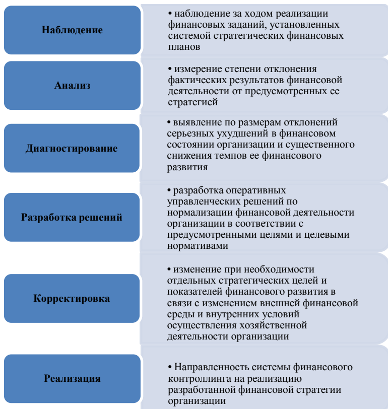
Рис. 7.1. Функции финансового контроллинга

Основные функции финансового контроллинга изложены на рис. 7.1.