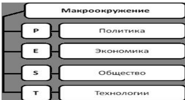
Рис. 4.1. Схема-аббревиатура PEST-анализа

– научно-техническая среда (Т): в какой степени бизнес зависит от нововведений и изменений; насколько динамичны темпы научно-технического прогресса в отрасли; какова доля функции научно-исследовательской и научно-технической работы в деятельности организации (рис. 4.1).