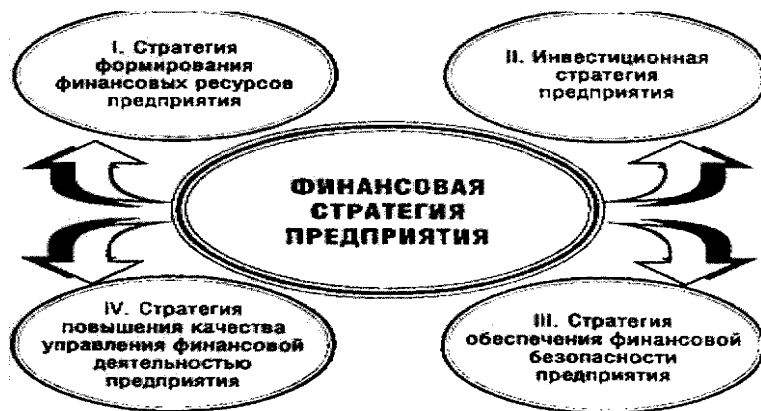
Рис. 2.1. Доминантные сферы развития финансовой деятельности

– стратегия повышения качества управления финансовой деятельностью организации. Параметры стратегического набора этой доминанты финансовой стратегии разрабатываются финансовыми службами организации и включаются в виде самостоятельного блока в корпоративную и отдельные функциональные стратегии организации.