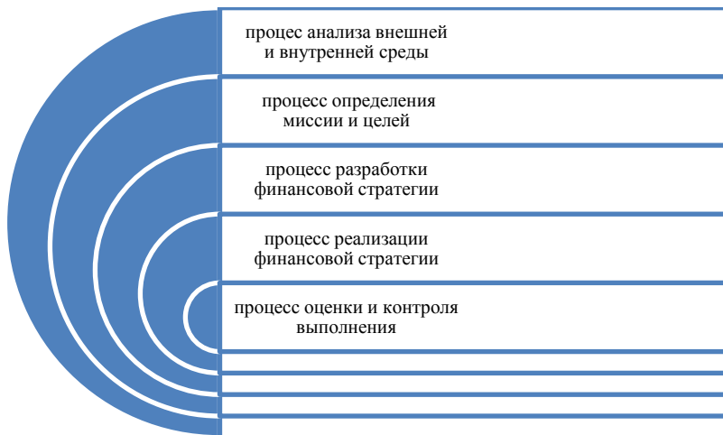
Рис. 1.1. Взаимосвязь управленческих процессов

Стратегическое финансовое управление можно рассматривать как взаимосвязь нескольких управленческих процессов (рис. 1.1).