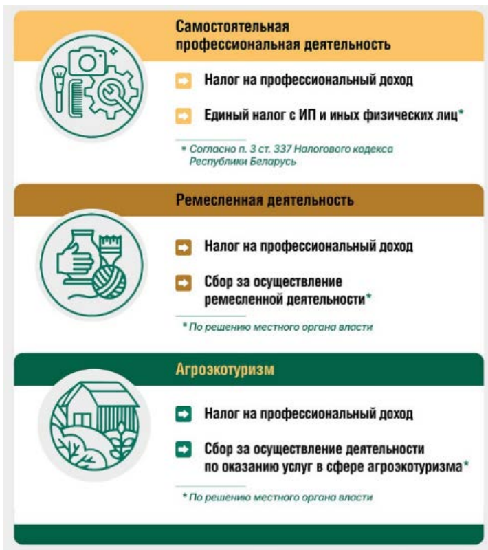
Рис. 3.1. Виды индивидуальной предпринимательской деятельности без регистрации в качестве индивидуального предпринимателя

С 1 октября 2024 г. одна из форм индивидуальной предпринимательской деятельности, которую гражданин вправе осуществлять без образования юридического лица, – самостоятельная профессиональная деятельность.